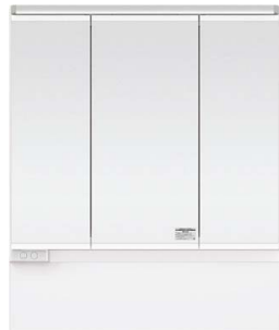
スリムLED3面鏡ミドルパネル