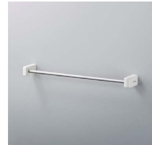
アラウノ向けトイレアクセサリタオルバー