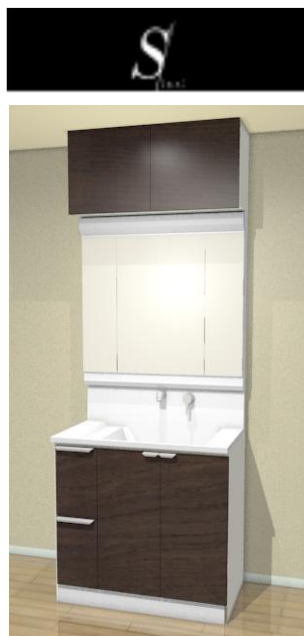
※オークミディアム