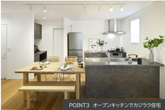
POINT3 オープンキッチンでカジャク住宅