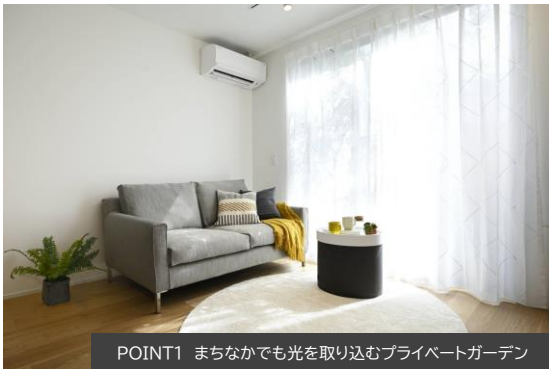
POINT1 まちなかでも光を取り込むプライベートガーデン