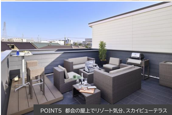
POINT5 都会の屋上でリゾート気分、スカイビューテラス