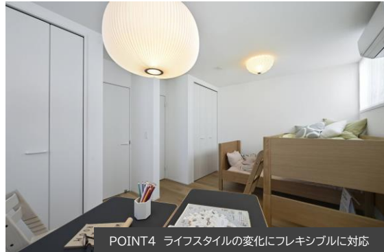
POINT4 ライフスタイルの変化にフレキシブルに対応