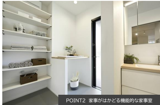
POINT2 家事がはかどる機能的な家事室