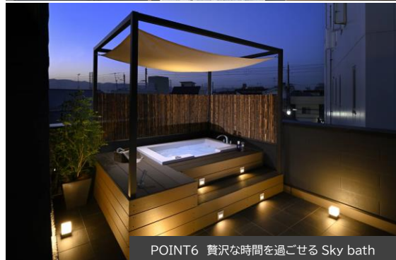
POINT6 贅沢な時間を過ごせる Sky bath