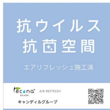
施工済みステッカー

ゼロ・コーポレーションでは、新型コロナウイルスをはじめとする様々なウイルスとの共存の時代に向け、先端の抗菌技術をいち早く全棟標準とすることにより、菌やウイルスから家族を守り、少しでも安心して暮らしていただける、健康で快適な住まいをご提供してまいります。